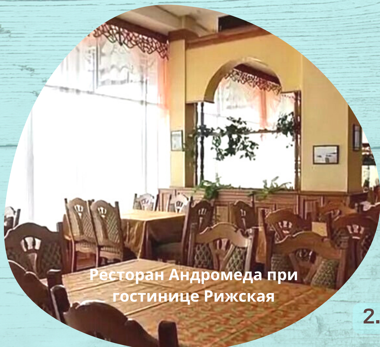
Ресторан Андромеда при гостинице Рижская